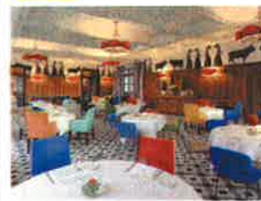
Le restaurant Lou Marquès

s'être essayé au papeton d'aubergine à la provençale et herbes du jardin et au risotto au riz rouge de Camargue et langoustines, le tout arrosé de l'incontournable Grand Cru Château Simone, servi depuis 1928.